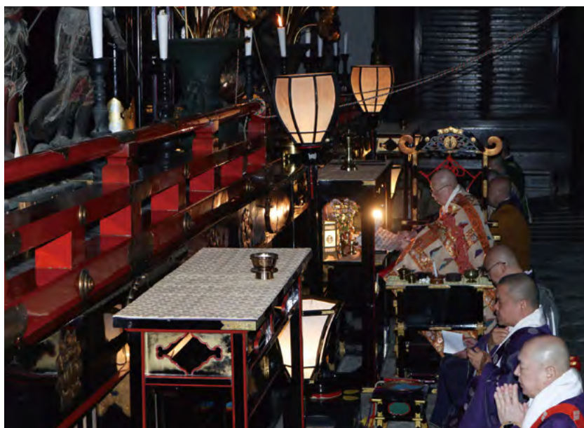
感染症拡大のため本堂内々陣で奉修された「水の日」浄水讃仰法要