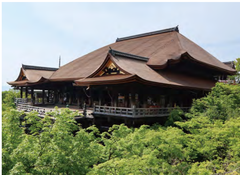
本堂 半世紀ぶりの麗姿