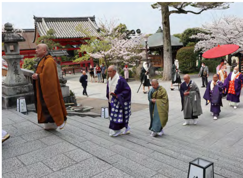
桜が咲く中、「水の日」法要の本堂へ行道する出仕僧侶