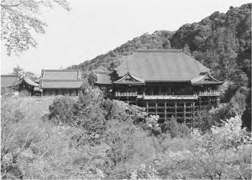
桜が咲き東山の緑が迫る清水寺の境内

いて、足元には夜明けしたばかりの境内にポツポツと桜が花を咲かせております。「さすが世界遺産、むべなるかな。こんな光景を自分一人で見ているのはもったいないなあ」とつくづく思うのです。