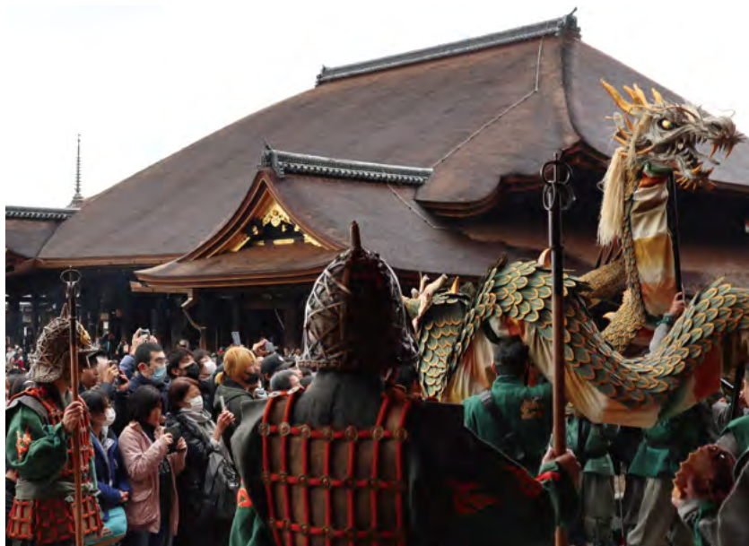
檜皮葺き替えを終えた本堂を背景に奥の院を出立する青龍会