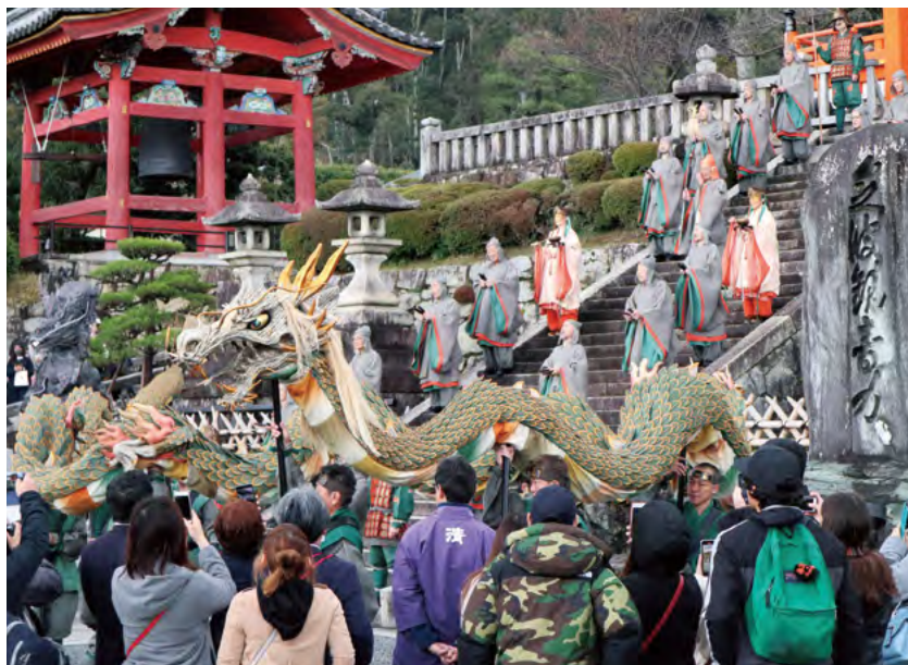
西門下を行道する青龍会